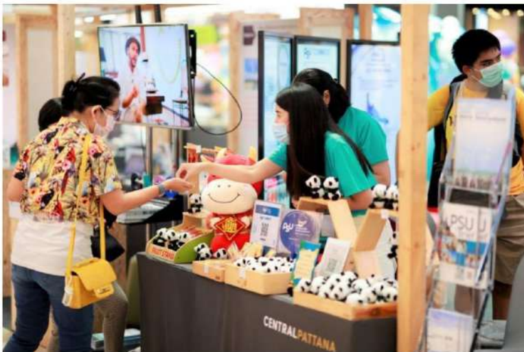
ม.อ.ส่งต่อความรู้ผู้ประกอบการ เปิดร้านค้าออนไลน์สร้างรายได้

นอกจากนี้ ยังมีการจัดนิทรรศการของหน่วยงานมหาวิทยาลัย อาทิ สถาบันฮาลาล สำนักพัฒนาทรัพยากรมนุษย์และพันธกิจสังคม (สมส.) พร้อมเปิดตัวศูนย์กิจการนานาชาติและสื่อสารองค์กร (GACC – Global Affairs and Corporate Communication Center) เพื่อสนับสนุนให้เกิดความร่วมมือกับต่างประเทศ พัฒนาสมรรถนะสากลขององค์กร บุคลากร และนักศึกษา และส่งเสริมความเป็นนานาชาติของมหาวิทยาลัย และยังเป็นศูนย์กลางการสื่อสารและส่งเสริมภาพลักษณ์ 5 วิทยาเขต รวมทั้งเป็นสื่อกลางการนำเสนอข่าวสาร ความรู้ และช่วยเหลือประชาชนในยามวิกฤต โดยปัจจุบันมีสมาชิก "PSU Bazaar" 50,000 ราย