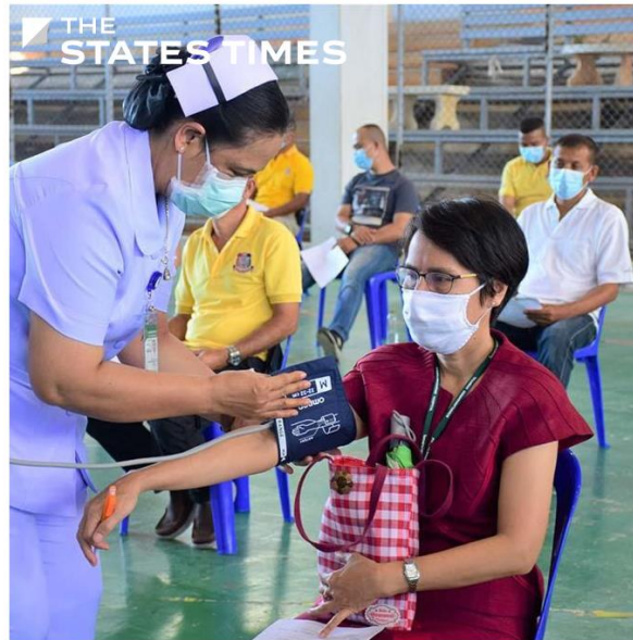
สงขลา - ม.อ. พร้อม !! เตรียมพื้นที่ฉีดวัคซีนโควิด-19 ดีเด่น 7 มิ.ย. นี้ รองรับ 1,000-2,000 คนต่อวัน