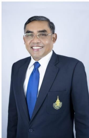
ผศ.ดร.นิรัตน์ แก้วประดิม อธิการบดีมหาวิทยาลัยสงขลานครินทร์ (ม.อ.)

มหาวิทยาลัยสงขลานครินทร์ (ม.อ.) ประกาศความพร้อม เปิดโรงพยาบาลสนามรับผู้ป่วย Covid-19 ระลอก 3 ผนึก 5 วิทยาเขต จัดสรรพื้นที่ เต็มถนอม อุปกรณ์การรักษามูลค่าทางทหารพร้อมเตียงผู้ป่วยติดล้ออีก 300 เตียง ชูแนวทางปฏิบัติคัดแยกผู้ป่วยตามกลุ่มอาการ วางระบบการคัดแยกเชื้ออย่างรัดกุม เพื่อสร้างความมั่นใจให้ผู้ป่วย เจ้าหน้าที่ที่นำมาปฏิบัติงาน และชุมชนรอบข้าง พร้อมเปิดบริจาคเงินสนับสนุน รพ.สุราษฎร์ธานี และ "อุ้มมีสุข" ช่วยเหลือผู้ประสบปัญหาทางเศรษฐกิจให้เดินหน้าต่อไปได้