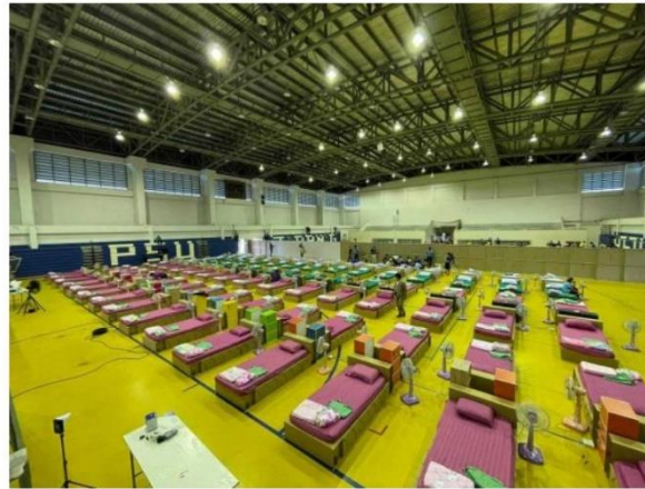
ม.อ. ผนึกกำลัง 5 วิทยาเขตภาคใต้ เปิดโรงพยาบาลสนาม

ถูกใจ M Soray Salaeh และคนอื่นๆ อีก 1.2 แสน คนถูกใจสิ่งนี้