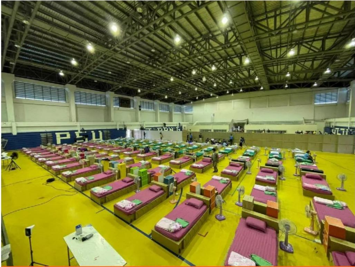
ม.อ.พนัก 5 วิทยาเขตเตรียมเปิดรพ.สนามรับผู้ป่วย Covid-19

ในสถานการณ์ที่ทุกคนกำลังเผชิญการแพร่ระบาดของเชื้อไวรัส Covid-19 และหลายครอบครัวได้รับผลกระทบทางเศรษฐกิจ ทาง ม.อ.วิทยาเขตสุราษฎร์ธานี เปิดรับบริจาคเงิน เพื่อสนับสนุนโรงพยาบาลในจังหวัดสุราษฎร์ธานี และ " ตู้ปันสุข " เพื่อร่วมบริจาค ข้าวสาร อาหารแห้ง น้ำดื่ม และของใช้ที่จำเป็นให้กับผู้ที่เดือดร้อนให้สามารถเดินทางไป รวมทั้งขอร่วมส่งกำลังใจให้กับ บุคลากรทางการแพทย์ นางพยาบาล และเจ้าหน้าที่ปฏิบัติงานด้านต่างๆ ที่ทุ่มเทและเสียสละดูแลผู้ป่วยติดเชื้อเพื่อให้ ประเทศไทยฝ่าวิกฤตในครั้งนี้